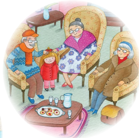
residencia de ancianos