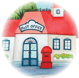
oficina de correos